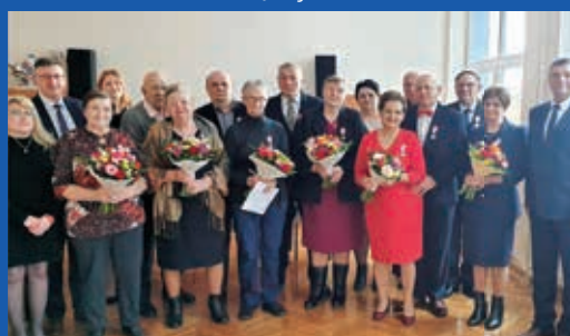
Złote Gody mieszkańców Gminy Potworów Więcej s.18