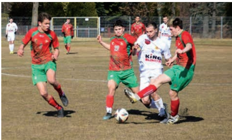
Inauguracja rundy wiosennej sezonu 2021/2022 z KS Raszyn