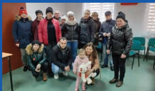
Spółeczność Gielniowa wspiera ludzi w potrzebie Więcej s.12