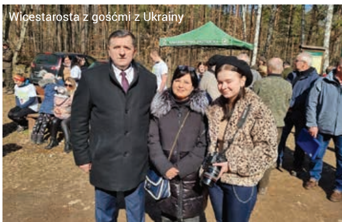
Wicestarosta z gośćmi z Ukrainy