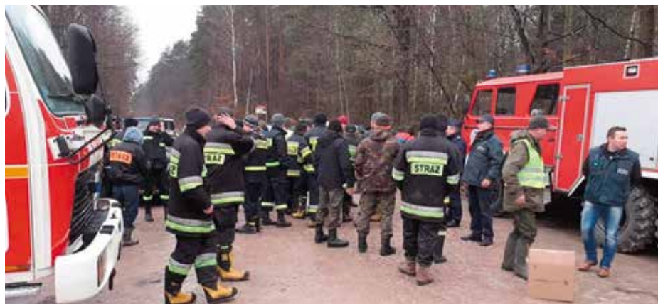
Poszukiwania padłych dzików w gminie Przysucha.

Stwierdzono pierwszy przypadek ASF w powiecie przysuskim. Badania potwierdziły, że dzik znaleziony 21 stycznia na terenie gminy Gielniów miał wirusa Afrykańskiego Pomoru Świń.