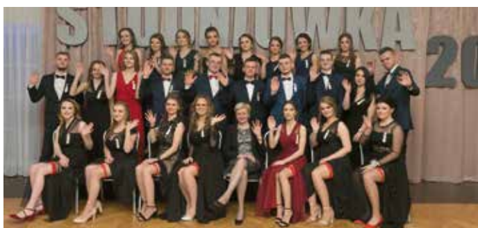
Technikum żywienia i usług gastronomicznych.