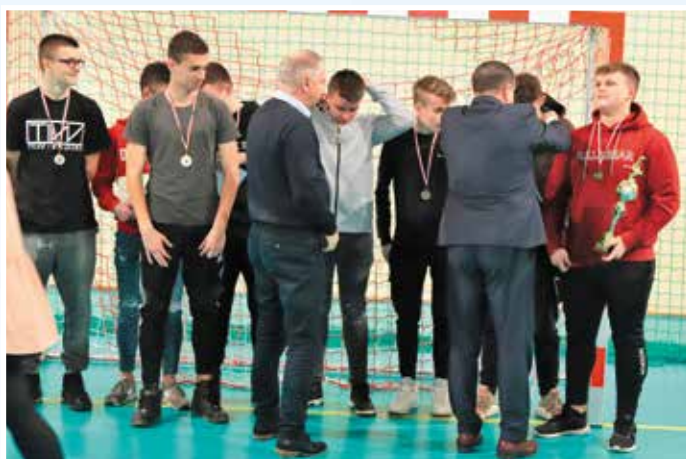
Długo oczekiwany moment - nagrody dla najlepszych.