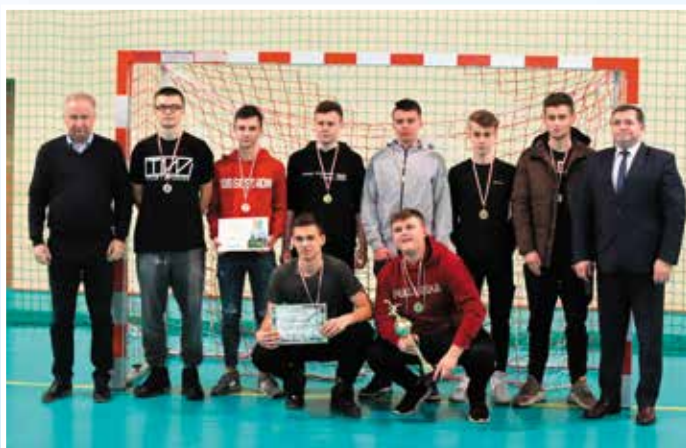
LKS Dębiaki - I miejsce w II lidze.