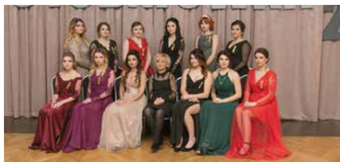
Technikum usług fryzjerskich.