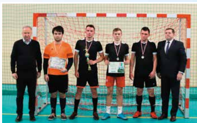
Rdzów - II miejsce w II lidze.