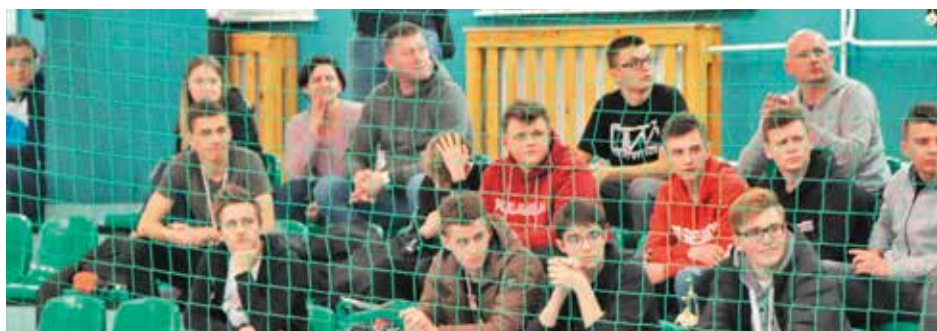
Publiczność nigdy nie zawiodła. Zawsze pełne emocji i kibiców trybuny to znak ligi.