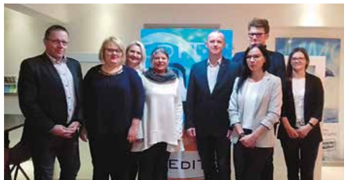
Grupa projektowa podczas wizyty studyjnej.