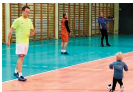
Następcy już trenują, a to znaczy, że rozgrywki będą jeszcze długo.