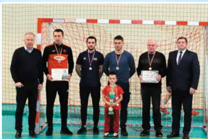
PRD Gielniów - II miejsce w I lidze.