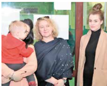
Na rozgrywkach nie brakowało najmłodszych fanów piłki nożnej.