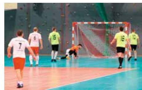
Ostatni mecz był najpiękniejszy.