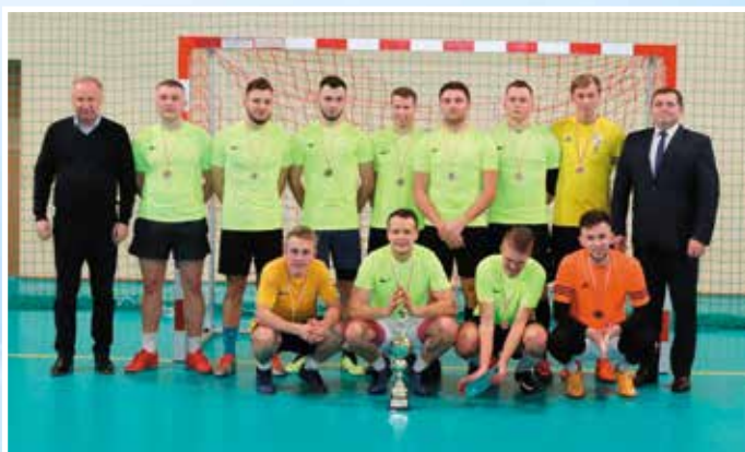
Młodzik Team - III miejsce w I Lidze.