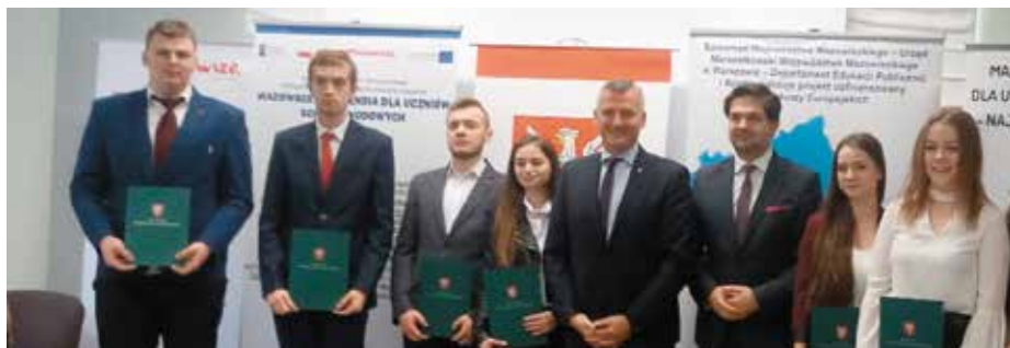
Stypendyści Marszałka Województwa mazowieckiego z ZS 2 2020.