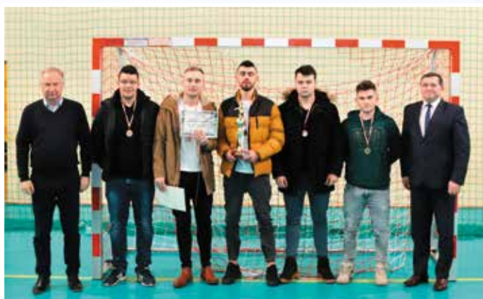
Sokół Sokolniki Suche - III miejsce w II lidze.