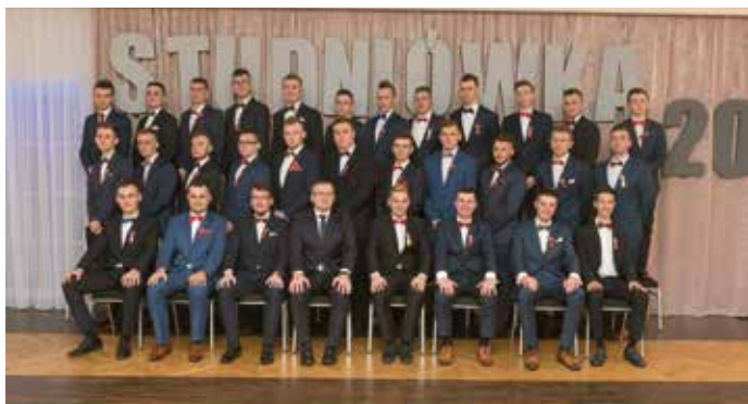
Technikum pojazdów samochodowych.