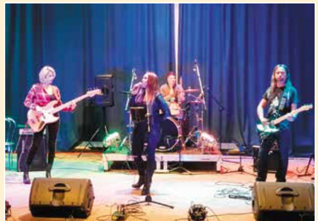
Występ zespołu Just In Case.