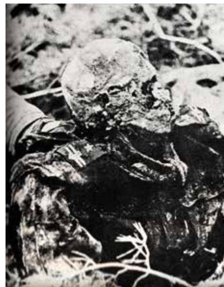
Zwłoki ś.p. mjr Adama Solskiego.