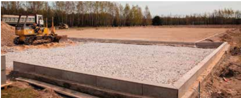
Budowa boiska wielofunkcyjnego w Beżniku.