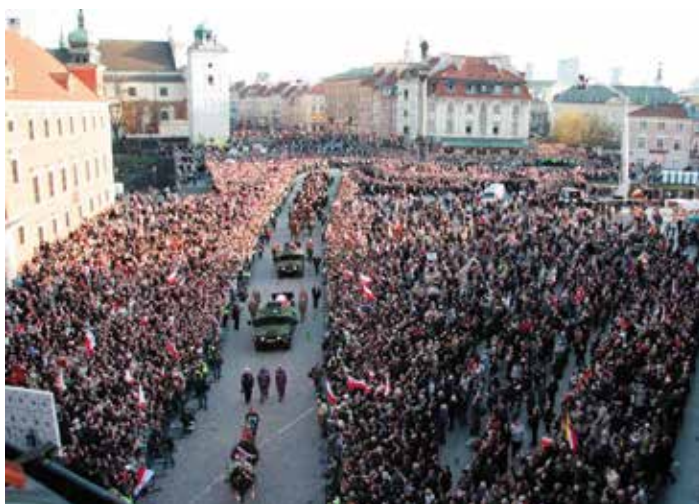
Tłumy na pogrzebie Lecha i Marii Kaczyńskich.