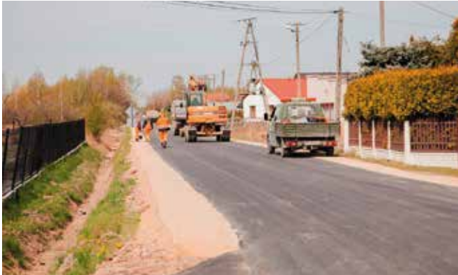
Prace na odcinku Zbożenna-Skrzyżsko Gościniac.