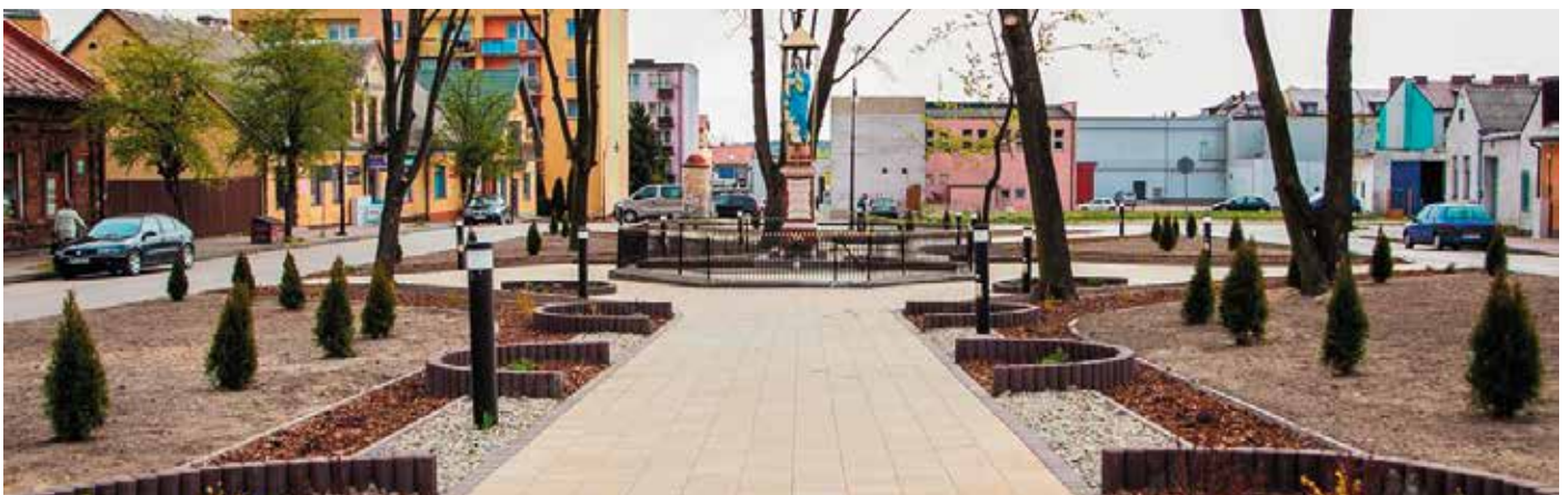
Pl. Kardynała Stefana Wyszyńskiego w Przysusze.