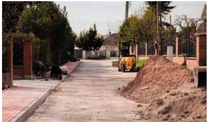
Roboty drogowe na ul. Świętokrzyskiej w Przysusze.