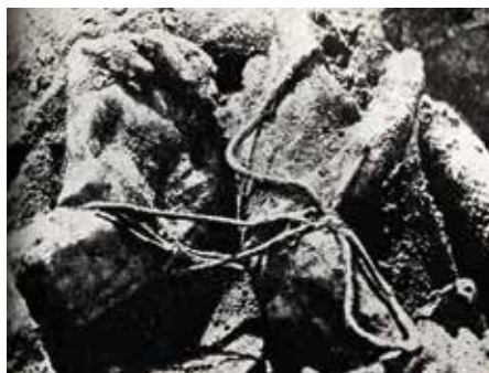
Ofiarom krępowano wykręcone do tyłu ręce.