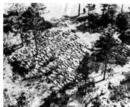
Ofiary zbrodni po ekshumacji.