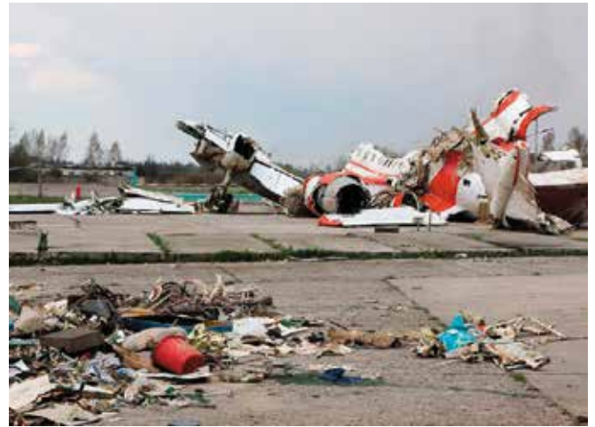
Pozostałości po TU-154M.