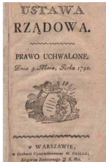
Konstytucja 3 maja.

Akcja powoduje reakcję, sprzyjającą reformom okoliczności skończyły się jeszcze przed uchwaleniem Konstytucji. Jak się łatwo można było spodziewać, takie reformy stanowiły krok za daleko dla obrońców „złotej wolności”. W oczywisty sposób stanowiły one zagrożenie także dla interesów Rosji, która roztaczała nad Rzeczypospolitą swój „protektorat”. Reakcja z obydwu tych stron musiała nadejść. Warto zadać sobie pytanie, dlaczego w ogóle zdecydowano się spróbować szczęścia z reformami wbrew samej części stanu szlacheckiego, przy okazji prowokując potężnego sąsiada? Trzeba przyznać, że sytuacja międzynarodowa była dla reformatorów korzystna. Rosja była zajęta wojną z Turcją i Szwecją, w praktyce od rozpoczęcia obrad Sejmu Czteroletniego właściwie caryca Katarzyna Wielka dokonała szeregu ustępstw na rzecz Polski i Litwy. Między innymi wycofała z terytorium Rzeczypospolitej rosyjskie garnizony, wyraziła nawet zgodę na zwiększenie stanu polskiej armii do 100 tysięcy żołnierzy. Nie bez powodu – liczyła na udział tych sił w walkach po stronie Rosji. Tymczasem Rzeczypospolita związała się przymierzem z Prusami. Niestety dla reformatorów, jeszcze przed uchwaleniem Konstytucji 3 Maja, wojna Rosji z Turcją się skończyła. Losy reform