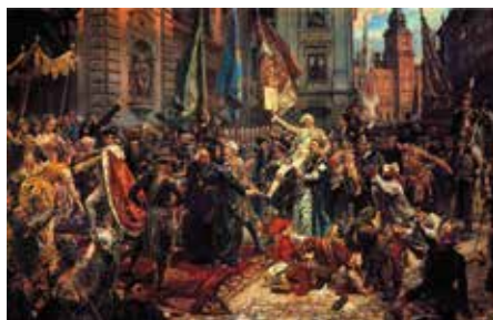
Król na barkach wiwatującego tłumu po uchwaleniu konstytucji.